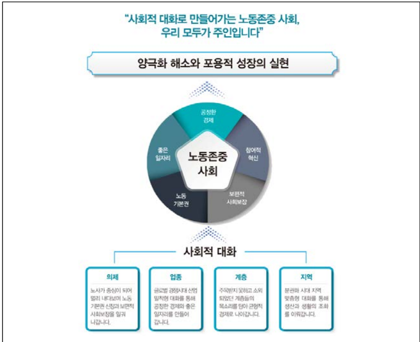
(그림 3-2) 노동존중사회와 사회적 대화