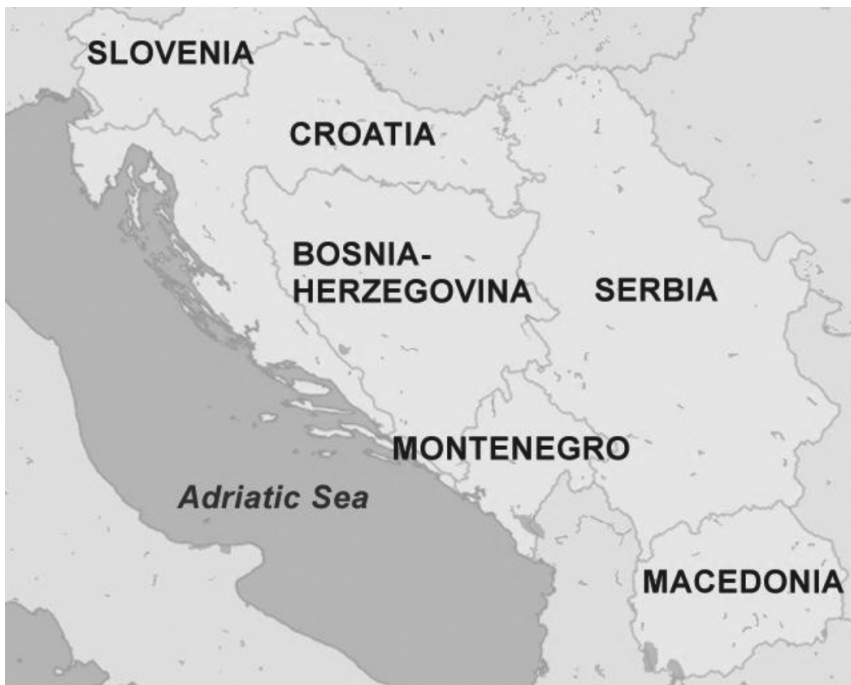
[그림 1] 유고슬라비아 6개 공화국

유고슬라비아는 어느 정도 경제·사회적 발전을 이루었고 동유럽 사회주의 국가 중 가장 개방적인 입장을 취했지만 1991년 유혈사태로 무너졌다. 베를린 장벽의 붕괴가 의미하는 새로운 지정학적 질서, 유고슬라비아 구성 공화국 간 상당한 경제발전 수준 격차, 정치적 개혁을 둘러싼 정치 엘리트 간의 이견, 과거사에서 비롯된 여러 민족 집단 간 신뢰 부족 등이 유고슬라비아의 해체를 가져온 주요 요인으로 거론된다. 부록의 <부표 1>은 1980년부터 1989년까지 유고슬라비아의 경제적 쇠퇴가 각 공화국에 불균등하게 나타난 것을 보여주고 있으며, [그림 1]은 현재는 모두 독립국가인 유고슬라비아를 구성하던 6개 공화국의 지도이다.